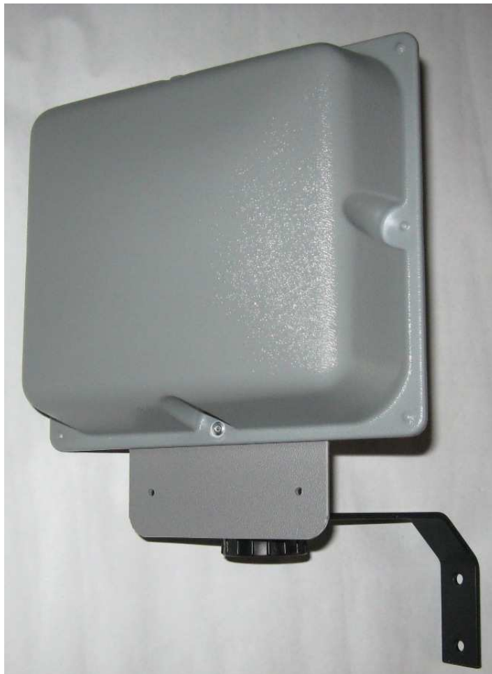
Рис.1 АКМ-900(Н), вид с переди.

Разработка была проведена с целью снижения стоимости АКМ-900(Н) (отказ от применения дорогостоящих импортных компонентов), при условии сохранения и улучшения технических характеристик, предыдущих моделей.