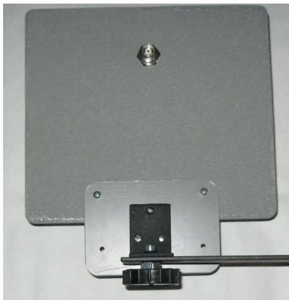
Рис.2 АКМ-900(Н), вид сзади.

Внешний вид и габаритные размеры и крепление антенного комплекса антенного комплекса АКМ-900(Н) позволяют его использовать, как с наружи зданий, так и внутри помещений.